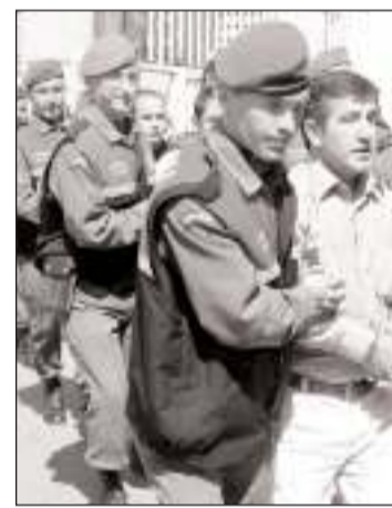
Sanıklar adliyeye götürülürken saldırıda ölenlerin yakınları tarafından tepkiyle karşılandı. Bazı mağdur yakınları baygınlık geçirdi.